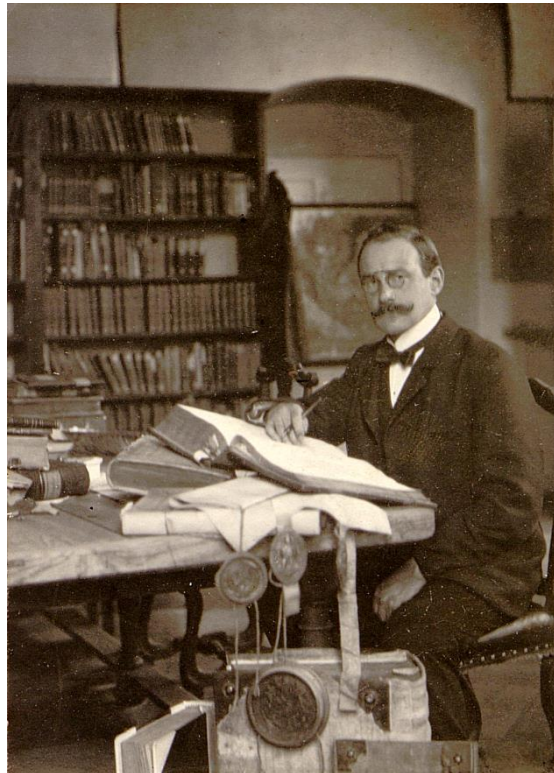
Staatsarchiv Würzburg, Familienarchiv Glück 96.