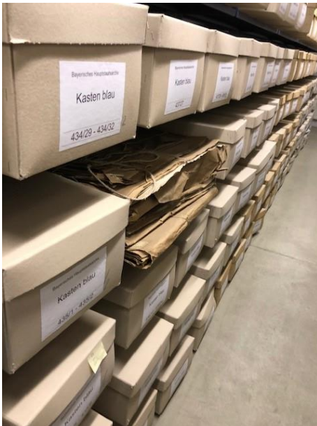
Bestand Kasten blau vor Durchführung der Bestandserhaltungsmaßnahme.

Bayerisches Hauptstaatsarchiv, Kasten blau 97/5, gereinigt und neu verpackt.