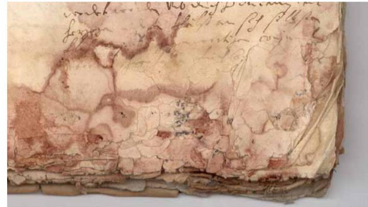
BayHStA, Kasten blau 60/38