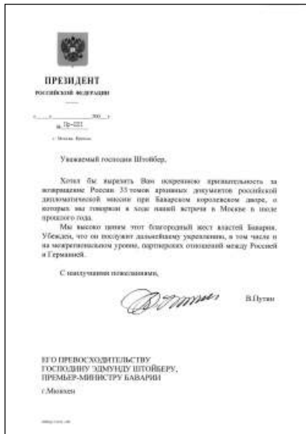
Dankschreiben des Präsidenten der Russischen Föderation Wladimir Putin an den Bayerischen Ministerpräsidenten Dr. Edmund Stoiber