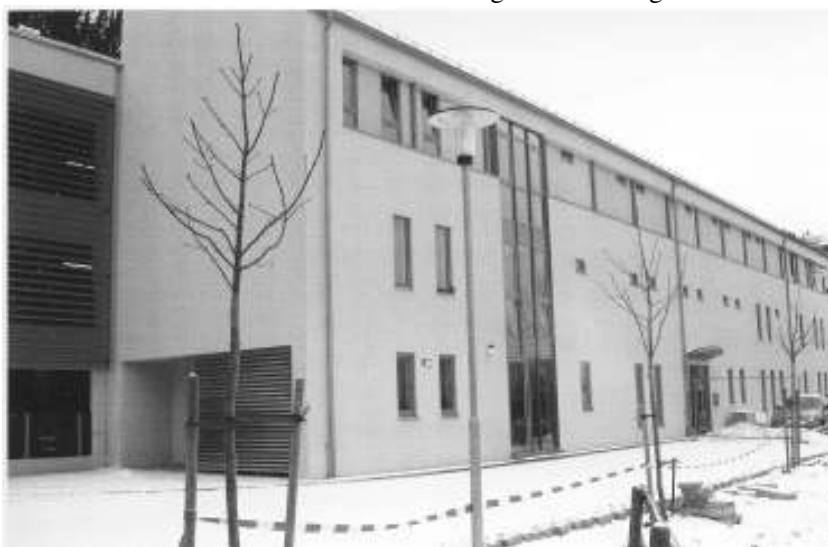
Aus: Festschrift zur Einweihung des neuen Stadtarchivs 2002

Der Kulturfonds wurde 1996 im Rahmen der „Offensive Zukunft Bayern II“ aus Privatisierungserlösen eingerichtet. Aus den jährlichen