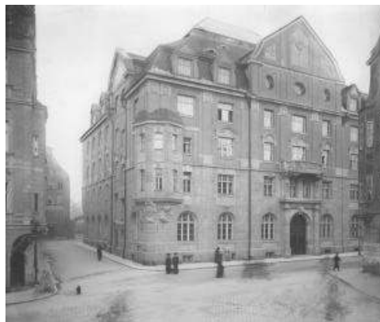
Gebäude der Oberpostdirektion Augsburg um 1900

Zentralbehörden) und die regional zuständigen Staatsarchive (Mittelbehörden) verteilt. Das Staatsarchiv Augsburg erhielt dabei das Schriftgut der zwischen 1808 und 1945 existierenden bayerisch-schwäbischen Mittelbehörde der Post sowie des Telegrafenamts Augsburg. Das Material erstreckt sich auf das gesamte Aufgabenfeld der Postmittelbehörde vom Post- und Personenver-