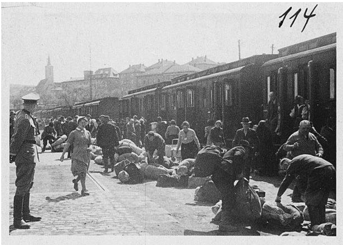
Dritte Deportation mainfränkischer Juden am 25. April 1942: Gepäckverladung am Bahnhof Würzburg-Aumühle

portation der mainfränkischen Juden handelt es