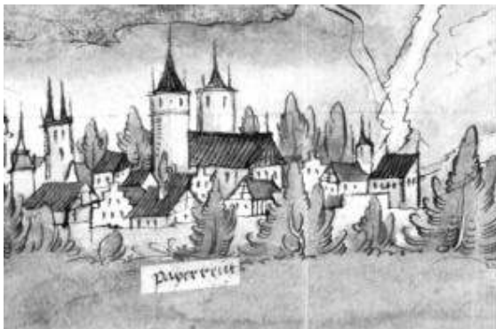
Ansicht von Bayreuth ("Payerreut") auf der handgezeichneten Karte von 1531 (Staatsarchiv Bamberg, C 3 Nr. 1858)

Die Staatlichen Archive Bayerns hatten auch heuer wieder Gelegenheit, beim Tag der offenen Tür in der Bayerischen Staatskanzlei (11./12. Juli) ausgewählte Dokumente aus ihren Beständen dem interessierten Publikum zu präsentieren. In einem eigens für diesen Zweck zu einer „Schatzkam-