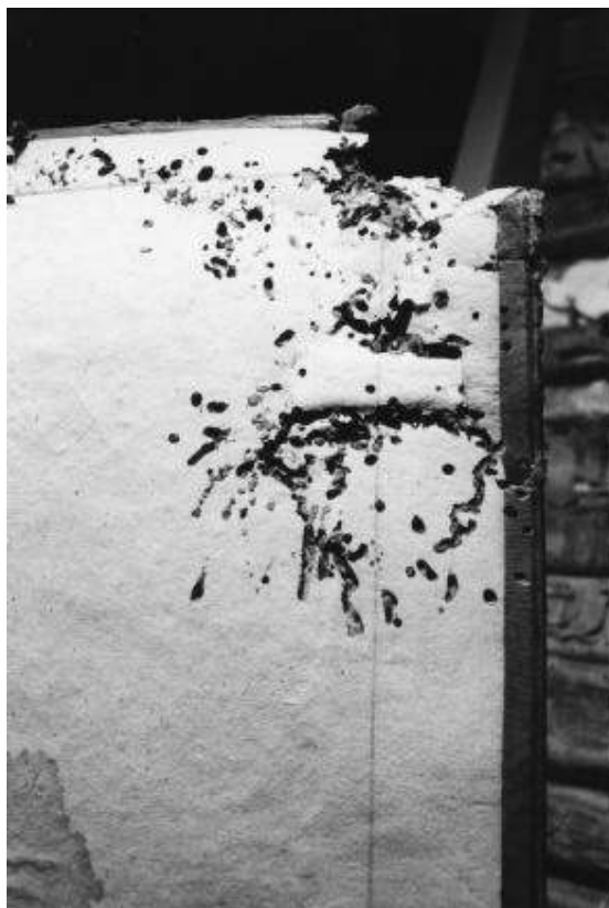
Einbanddeckel mit Fraßschäden

Nach dem Ende der Schwärmzeit 2003 lässt sich Folgendes resümieren. Die Tiefkühlung war sehr erfolgreich, das Auftreten des Gemeinen Nagekäfers ist rapide zurückgegangen. Schäden oder Veränderungen an behandelten Archivalien sind nicht erkennbar. Zur langfristigen Beobachtung wurden kleine Zettel mit der Beschriftung „Dieser Band wurde am 22. August 2002 wegen