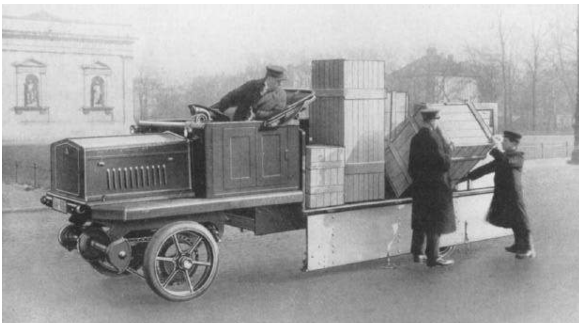
Bereits in den 20er Jahren nutzte die Post für Transporte und Zustellungen auch Elektrolastwagen wie dieses Modell der Firma Konrad Justus Braun.

wurde neu geordnet (vgl. S. 10 f.) und gab Anlass, eine Ausstellung zur bayerisch-schwäbischen Postgeschichte zu veranstalten, die vom 9.