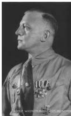
Bayerisches Hauptstaatsarchiv, NL Adolf Wagner

Adolf Wagner, der schon 1922 der NSDAP beigetreten war, war von 1929 bis 1942 Gauleiter von München-Oberbayern, von 1933 bis 1944 Bayerischer Staatsminister des Innern und von 1936 bis 1944 auch Bayerischer Staatsminister für Unterricht und Kultus. Der Nachlass enthält neben persönlichen und biographischen Unterlagen Notizkalender und Diensttagebücher Wagners, private und dienstliche Korrespondenzen, Sachakten aus den Ministerien (z.B. zur so genannten Reichskristallnacht), Tagebucheintragen über Begegnungen mit Hitler, Redestichworte und -