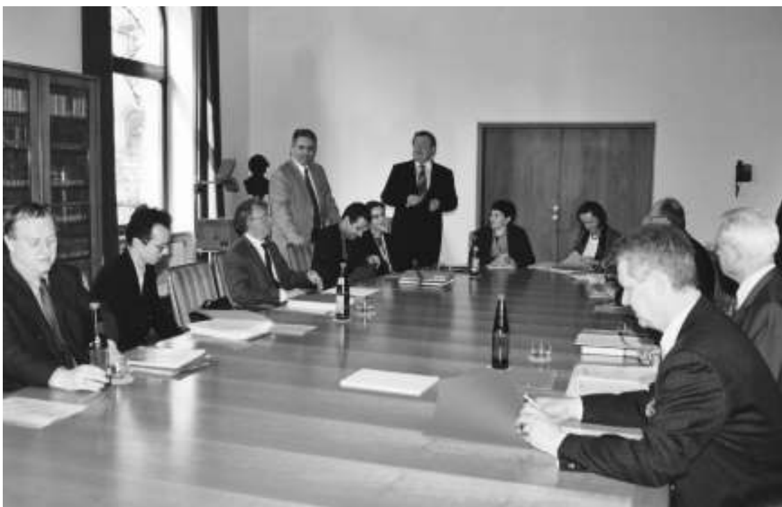
Tagung des „Comité Scientifique“ am 1. April 2004 in der Generaldirektion

Die staatlichen Archive Bayerns und die Direction des Archives de France bereiten unter dem Titel „Bayern und Frankreich: Wege und Begegnungen. 1000 Jahre bayerisch-französische Beziehungen“ eine große Ausstellung vor. Sie wird im Oktober 2005 im Centre historique des Archives nationales in Paris unter dem französischen Titel „France-Bavière: Allers et retours. 1000 ans de relations franco-bavaroises“ und im Februar 2006 im Bayerischen Hauptstaatsarchiv in München gezeigt werden. Einbezogen sind auch die Archive des französischen Außen- und Verteidigungsministeriums. Exponate französischer und deutscher Leihgeber werden die Schau bereichern. Auf mehreren Sitzungen im vergangenen und in diesem Jahr in Paris und in München hat