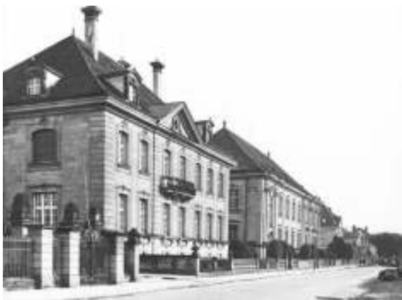
Staatsarchiv Bamberg (undatiert, wohl 1920er Jahre).

Den Anfang des Veranstaltungsreigens bildet am 19. Juli die Archivpflegertagung zum Thema „Archivgut als Kulturgut – Gemeindearchive in Oberfranken“, zu welcher neben den Kreisarchivpflegern auch alle in den oberfränkischen Gemeinden für Archiv und Registraturen Verantwortung tragenden Personen geladen werden. Am 11. September nutzt das Staatsarchiv den publikumswirksamen „Tag des offenen Denkmals“, um sein Gebäude in Zusammenarbeit mit dem Hochbauamt Bamberg zu präsentieren. Nach einem als Auftakt gedachten öffent-