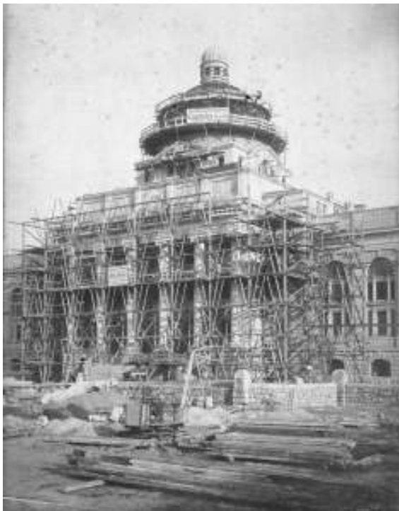
Bau der Kuppel des Armeemuseums, um 1903 (NL Kurz 19).

Vor einigen Jahren erhielt das Bayerische Hauptstaatsarchiv eine Mappe nicht identifizierter Fotos und Architekturzeichnungen geschenkt. Bald konnte festgestellt werden, dass es sich bei der Mappe um Teile des Nachlasses des Architekten Gottfried Kurz handelte, der 1866 in Nürnberg geboren wurde und 1935 in München starb. Kurz war nach seinem Studium an der Technischen Hochschule in München in die Militärbaubehörde eingetreten und wurde nach dem Erlöschen der bayerischen Armee 1920 in die Finanzbauverwaltung übernommen.