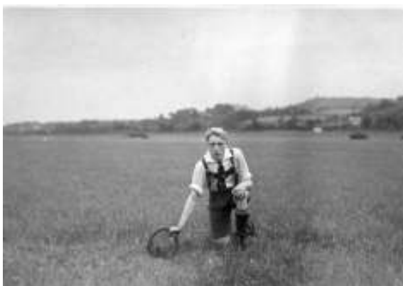
Befestigungsring für Zeppeline auf dem Notlandeplatz für Luftschiffe in Creidlitz.

In den 1930er Jahren hat das Landratsamt Coburg Photographien unter verschiedenen Gesichtspunkten in Auftrag gegeben, darunter Dokumentationen von Gebäuden, Naturdenkmälern und der hygienischen Verhältnisse auf dem Land sowie Dorfansichten mit Fahnschmuck zum 1. Mai 1936. Einer der beauftragten Photographen war der Tierarzt Dr. Thilo Brückner, der auch für den Thüringer Waldverein Dokumentationen erstellt