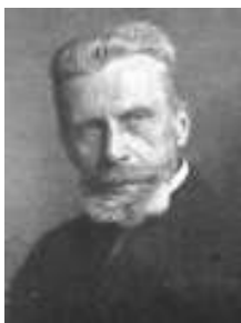
ergiebiges Nachlass des bayerischen Innenministers Maximilian Graf von Soden-Fraunhofen (1844–

beziehen, ins Staatsarchiv Landshut gelangen sollen. Das in der Abt. V deponierte Archiv beinhaltet umfangreiche Unterlagen aller Familienzweige vom 14. bis zum 20. Jahrhundert, vor allem der Freiherren von Soden und der Freiherren von Fraunhofen, die sich im 19. Jahrhundert durch Heirat verbanden und die Linie der Freiherren, seit 1916 Grafen von Soden-Fraunhofen begründeten.