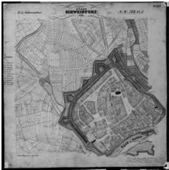
Flurkarte der Stadt Schweinfurt von 1834.

blätter, die Unikatcharakter besitzen und bislang nur in Form von Fotoreproduktionen von überwiegend geringer Qualität vorhanden waren, wird dieser Bestand derzeit noch einmal erheblich aufgewertet.