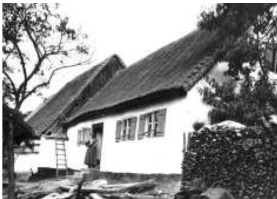
Bauernhaus mit strohgedecktem Dach in Altisheim.