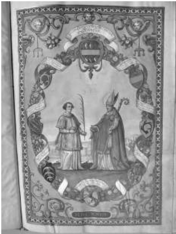
Archivverzeichnis mit farbiger Miniatur auf Pergament (Staatsarchiv Augsburg, Augsburg Damenstift St. Stephan, Münchener Bestand 225).

12 Farbfotos mit knappen inhaltlichen Erläuterungen am Ende des Heftes sollen dem Leser einen ersten Eindruck von der Reichhaltigkeit archivalischer Quellen in inhaltlicher und formaler Be-