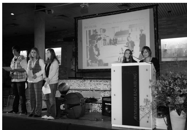
Schülerinnen und Schüler des Gymnasiums Bad Aibling präsentieren ihr Ausstellungsprojekt

„Die ersten und die letzten Tage“ an Schulen, die in Kooperation mit Universitäten und anderen Partnern die unmittelbare Übergangszeit von der NS-Herrschaft zum Neubeginn unter US-amerikanischer Besatzung 1945 untersuchen wollen. Bereits während des erfolgreich verlaufenen Pilotprojekts für den Landkreis Ebersberg waren das Bayerische Hauptstaatsarchiv und das Staatsarchiv München neben dem Münchener Institut für Bayerische Geschichte und dem Archiv des Erzbistums München und Freising als Netzwerkpartner beteiligt gewesen.