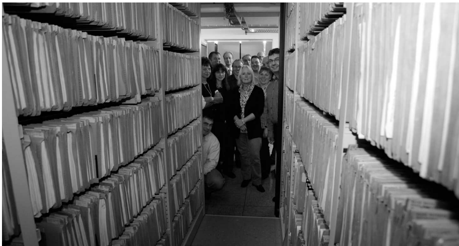
Landratsamt Unterallgäu

Firma Optimal Systems aus Hannover. Neben technischen Details wurde auch offen über die grundsätzlichen Probleme und Gefahren einer rein digitalen Schriftgutverwaltung diskutiert. Die Einführung eines die gesamte Verwaltung des Landratsamtes umfassenden Dokumentenmanagementsystems ist in nächster Zeit aus Kosten- und Organisationsgründen nicht geplant.