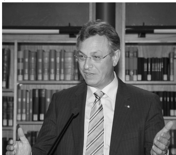
Staatsminister Siegfried Schneider

Anlässlich der Moskauer Wirtschaftstage in München hat die Bayerische Staatskanzlei nun schon zum dritten Mal eine Ausstellung im Bayerischen Hauptstaatsarchiv initiiert und finanziert. Die vorausgegangenen Ausstellungen galten dem 200. Geburtstag des Dichters und Diplomaten Fjodor Iwanowitsch Tjutschew (2003) und der „Russischen Avantgardekunst zwischen 1918 und 1930“ (2006).