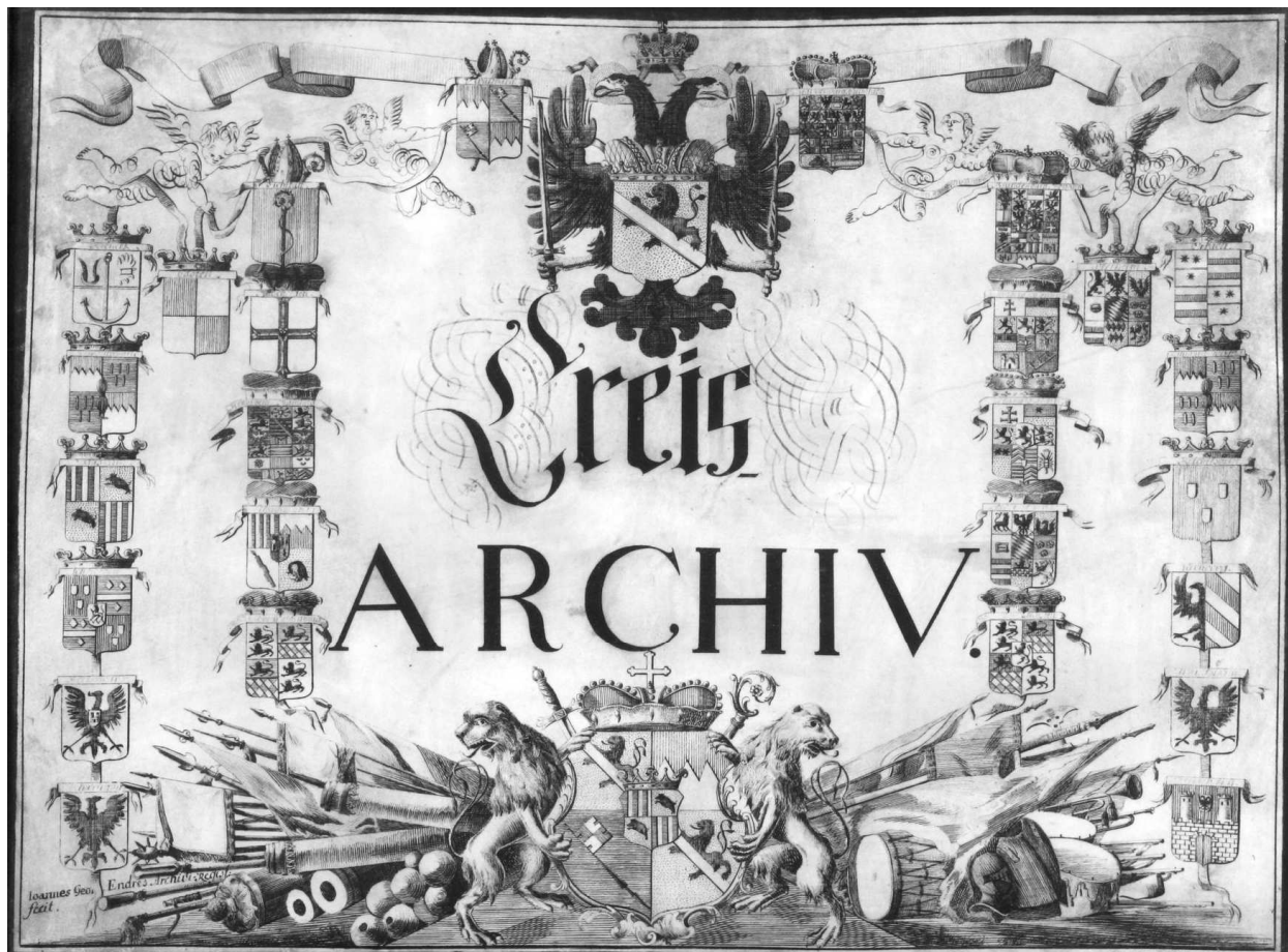
Vom „Kreisarchiv“ zum „Kreisarchiv“ – der Name bezeichnete im 18. Jahrhundert das Archiv des Fränkischen Kreises, im 19. Jahrhundert die Vorgängerbehörde des heutigen Staatsarchivs Bamberg

Damit wurde Quellengut neu erschlossen, das für die politische Geschichte der Region vom 16. bis zum 18. Jahrhundert hohe Aussagekraft besitzt, war doch der Reichskreis als Dachorganisation der fränkischen Territorien die tragende Kraft, wenn es um die Teilnahme an Reichskriegen, die Niederschlagung von Unruhen sowie die gemeinsame Bekämpfung von Seuchen und Hungersnöten ging. Politisch einflussreich waren vor allem die Hochstifte Bamberg und Würzburg, die Fürstentümer Brandenburg-Ansbach und Brandenburg-Bayreuth