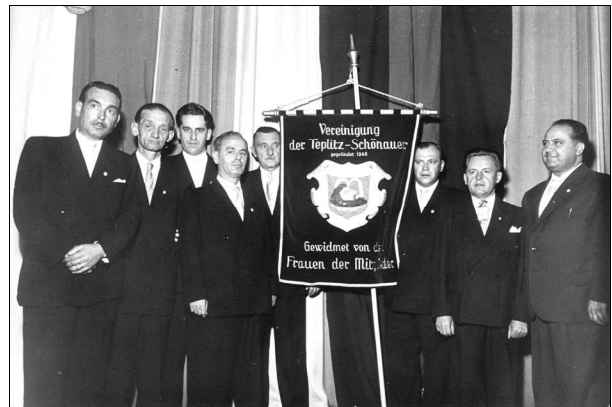
Vorstand der Vereinigung der Teplitz-Schönauer

Verbandes spiegelt die ursprüngliche Aufgabe der Vereinigung in den Nachkriegsjahren wieder: es ging um das Auffinden der ehemaligen Bewohner von Teplitz-Schönau nach der Vertreibung, um die Wiederherstellung gewachsener Netzwerke und auch um die Beweisführung über Besitz beim Lastenausgleich. Der 1950 gegründete Bauverein war eine Selbsthilfeeinrichtung, die dafür sorgen sollte die schlimmste Wohnungsnot zu lindern und eine Art landsmannschaftliche Nachbarschaft wieder aufzubauen. Gesellschaftliche Veranstaltungen wie Bälle oder Fahrten sollten den Zusammenhalt stärken.