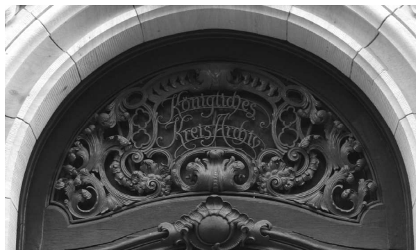
Eingang zum Staatsarchiv Bamberg

Die militärische Überlieferung der Kreistruppen ist nur zeitweilig in Form von Handakten der Offiziere in das Kreisarchiv eingegangen, während man eine eigenständige Überlieferung der meist von Brandenburg-Ansbach oder Brandenburg-Bayreuth bekleideten militärischen Führungsspitze („Kreisobristenamt“) in den Ansbach-Bayreuther Beständen vergeblich sucht.