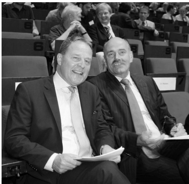
Staatsminister Dr. Wolfgang Heubisch und Oberbürgermeister der Stadt Regensburg Hans Schaidinger

Vom 22. bis 25. September 2009 trafen sich über 800 Archivarinnen und Archivare aus dem In- und Ausland auf dem 79. Deutschen Archivtag in Regensburg, der sich dem Thema „Archive im digitalen Zeitalter“ widmete.